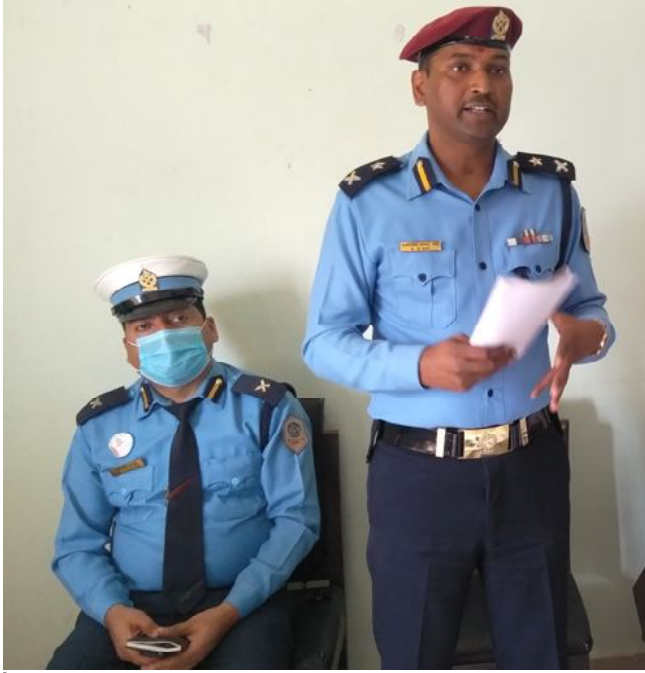
दैनिक समाचारदाता राजविराज, ११ फागुन ।

उनीहरूसँग ठूलो रकम कहाँबाट र कसरी आयो भन्ने विषयमा थप अनुसन्धान कार्य भइरहेको सशस्त्र प्रहरी उपरिक्षक श्रेष्ठले बताए ।