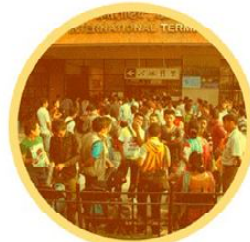
भिडभाड हुने स्थान जहाँ धेरै मान्छेहरु जम्मा भएका हुन्छन्

कोभिड-१९ बाट जोगिन तीन 'भ' बारे जानकारी राखौं