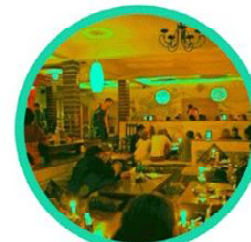
भौतिक दूरी कम हुने स्थान जहाँ नजिक बसेर वार्तालाप गर्नुपर्ने हुन्छ