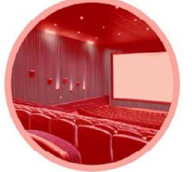
भेन्टिलेशन नभएको वा दोहोरो हावा नचल्ने स्थान